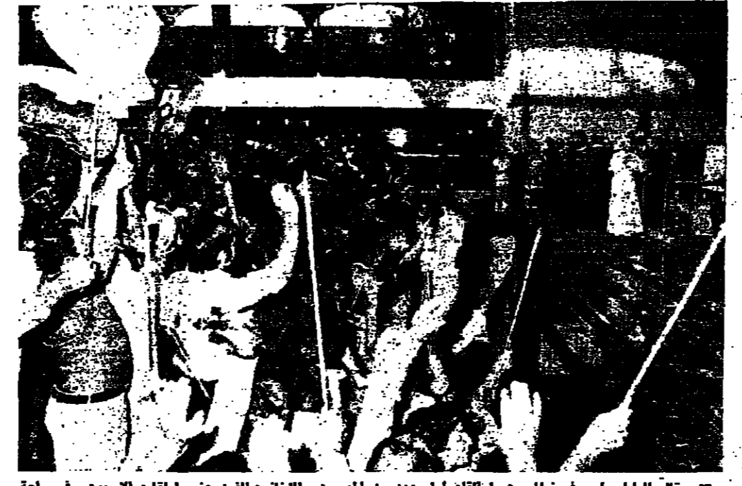
قال اليا يونس في خطاب هام لكاه ام عدد من المربين والبياتيين الذين حضروا لقائه السبوعي في ساحة كاتدرائية القديس بطرس في الفاتكان، ان الاتفاق الجديد لكاه الاربعة اشهر وشاذا من الاتفاق بين مصر واسرائيل، وادنى الاستقرار والسلم والتعاون بين الدول، وفي الصورتين واليا يونس في الفاتكان.